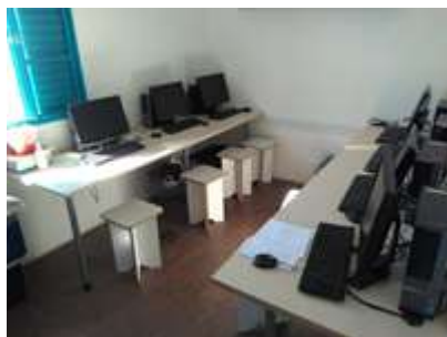
Sala de Informática