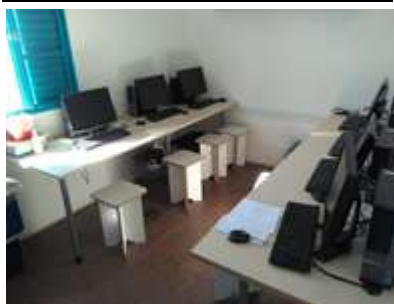
Sala de Informática